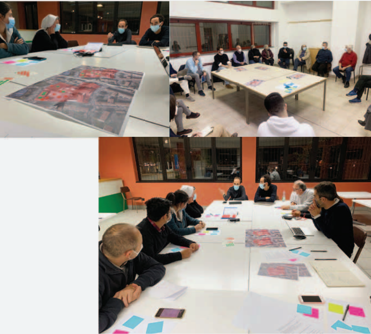
Fotografie dei lavori con le parrocchie. Polisocial SPèS, Politecnico di Milano, 2021.

azioni di rigenerazione a medio o lungo termine per i beni interessati, la loro priorità e l'entità degli interventi: una "schedatura", che aiuti a definire la via corretta per la trasformazione delle strutture, suggerendo, ad esempio, l'utilizzo in diverse fasce orarie, l'introduzione di nuove attività in relazione alle esigenze del quartiere, la trasformazione di alcuni spazi, ecc.