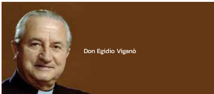
Don Egidio Viganò