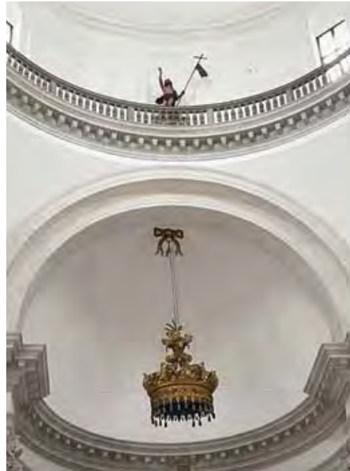
All'interno della basilica del Redentore.